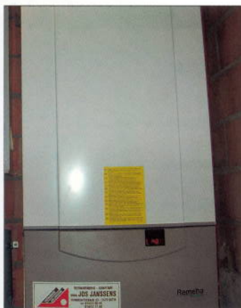
Chaudière à gaz murale à condensation