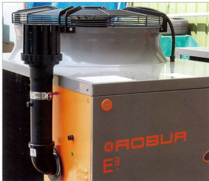
Pompe à chaleur à gaz à condensation air-eau avec puissance modulante

Pour absorber les charges créées dans les mois hivernaux et en guise de back-up dans le cas d'une panne temporaire d'une pompe à chaleur, on a installé une chaudière gaz à condensation comme système d'assistance d'une puissance de 84,2 kW.