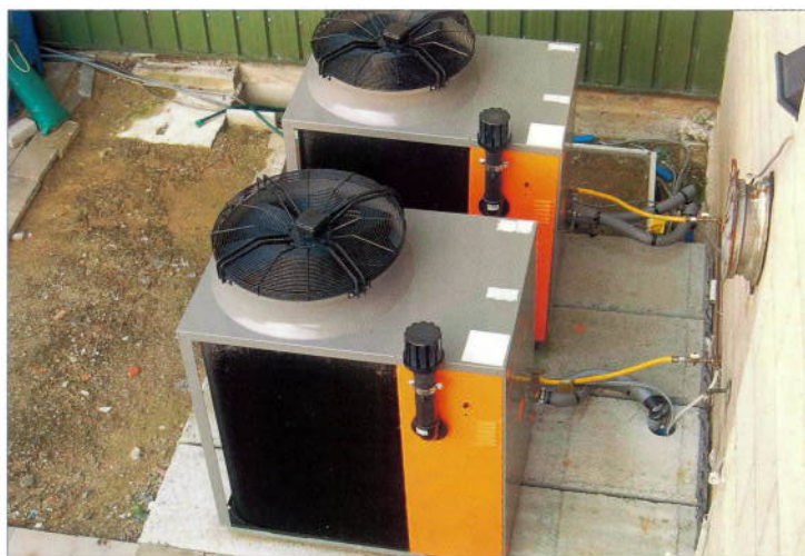
Deux pompes à chaleur à absorption à gaz: 35,4 kW

pompes à chaleur et d'une chaudière à gaz à condensation complémentaire, donc une solution combinée. La question s'est alors posée de savoir si, pour cette solution combinée, on choisirait des pompes à chaleur air-eau électriques ou des pompes à chaleur à absorption à gaz.