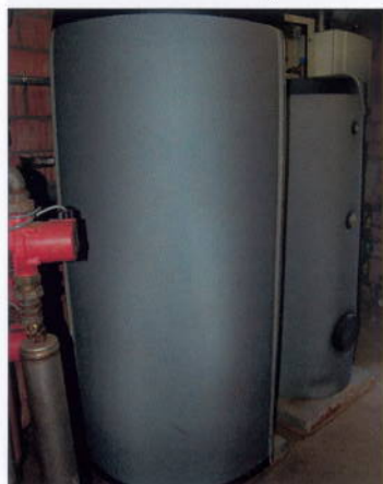
Ballon pour l'eau chaude sanitaire