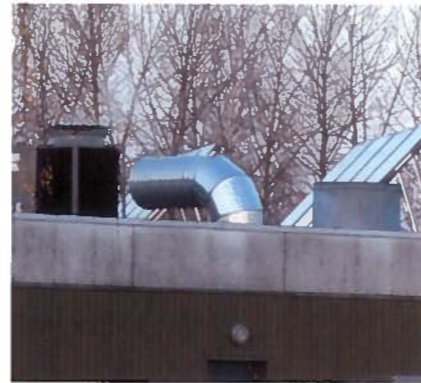
Figur 1: Placering af Robur E3 gasvarmepumpe og solfangere på Avedøre Stadion

Virkningsgraden for denne model er maks. ca. 160 % og afhænger af udetemperaturen og vandtemperaturen. Figuren viser, at hverken ydelsen eller virkningsgraden påvirkes lige så meget af udetemperaturen som