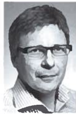
Af Mikael Näslund, Dansk Gasteknisk Center a/s