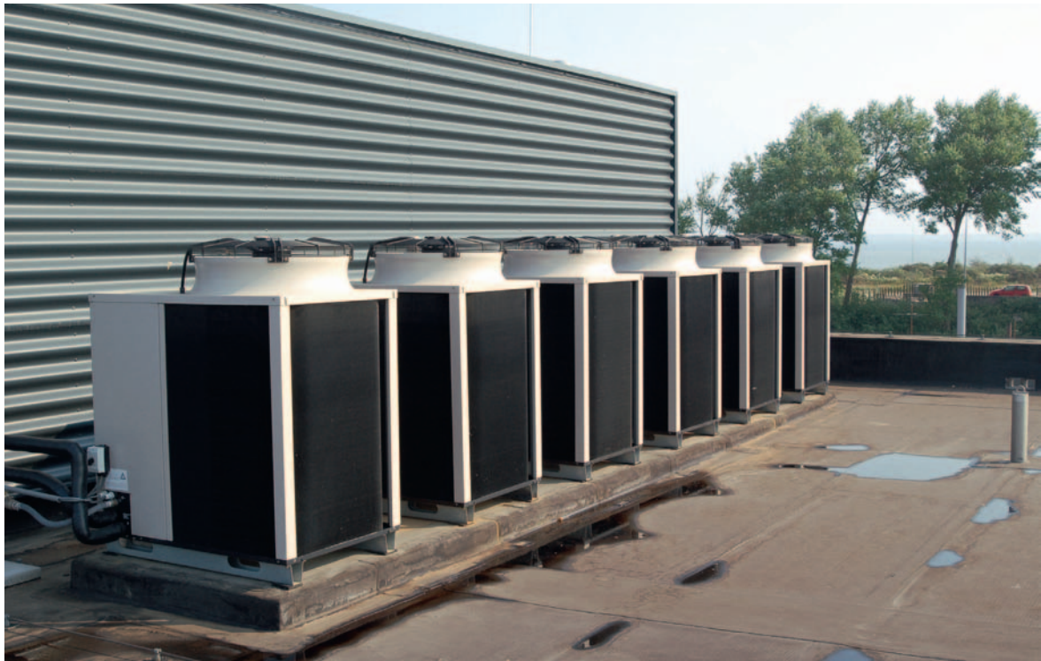
Op het dak van een woongebouw, zorginstelling of hotel kan probleemloos een aantal warmtepomptoestellen worden geplaatst, mits de dakconstructie daarop is berekend.

combineerd met cv-ketels. Het verschil is dat er een apart distributienet voor tapwater wordt aangelegd.